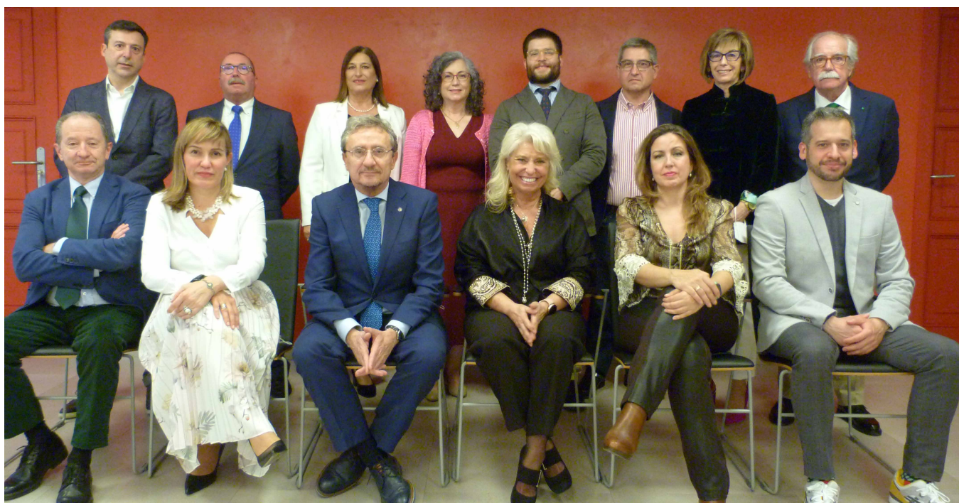
Foto de la Junta Directiva del Colegio de Médicos durante la toma de posesión oficial que se celebró el pasado mes de marzo

“Esta es una Junta Directiva muy preparada y con ganas de ofrecer soluciones prácticas e innovadoras, que es la única opción para mejorar un sistema regional y nacional de salud que necesita reformas, recursos y soluciones”, destacó el antiguo presidente del ICOMVA.