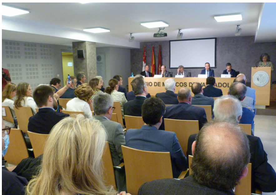
En esta ocasión, el acto fue abierto y a él acudieron muchos compañeros y amigos que no quisieron perderse esta toma de posesión de la Junta Directiva del ICOMVA