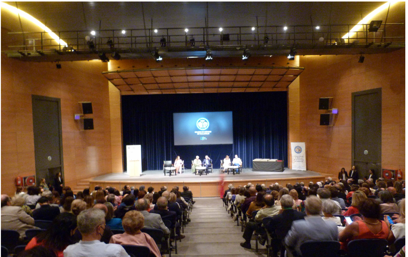
Centenares de médicos, amigos y familiares quisieron celebrar este día con su Colegio