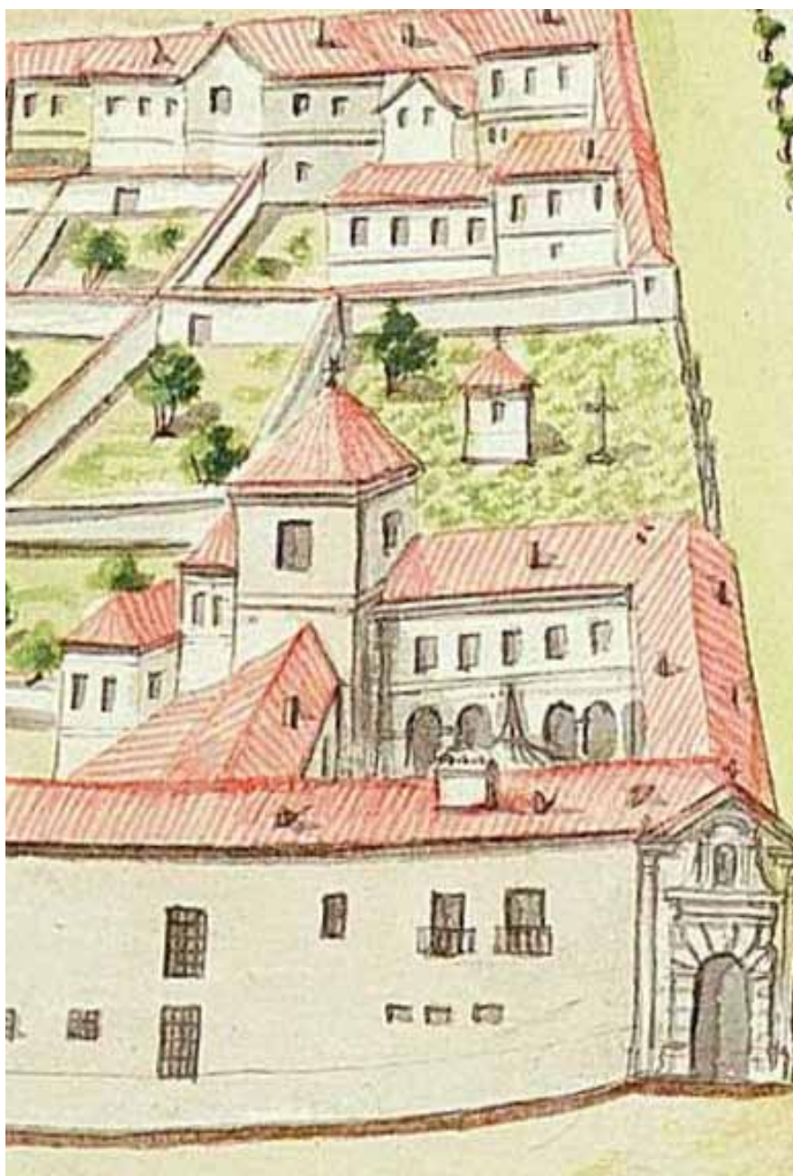
Hospital Real o General de la Resurrección, donde se realizaban las prácticas quirúrgicas. En la parte más alejada de la puerta principal se encontraban las instalaciones docentes y los anfiteatros anatómicos