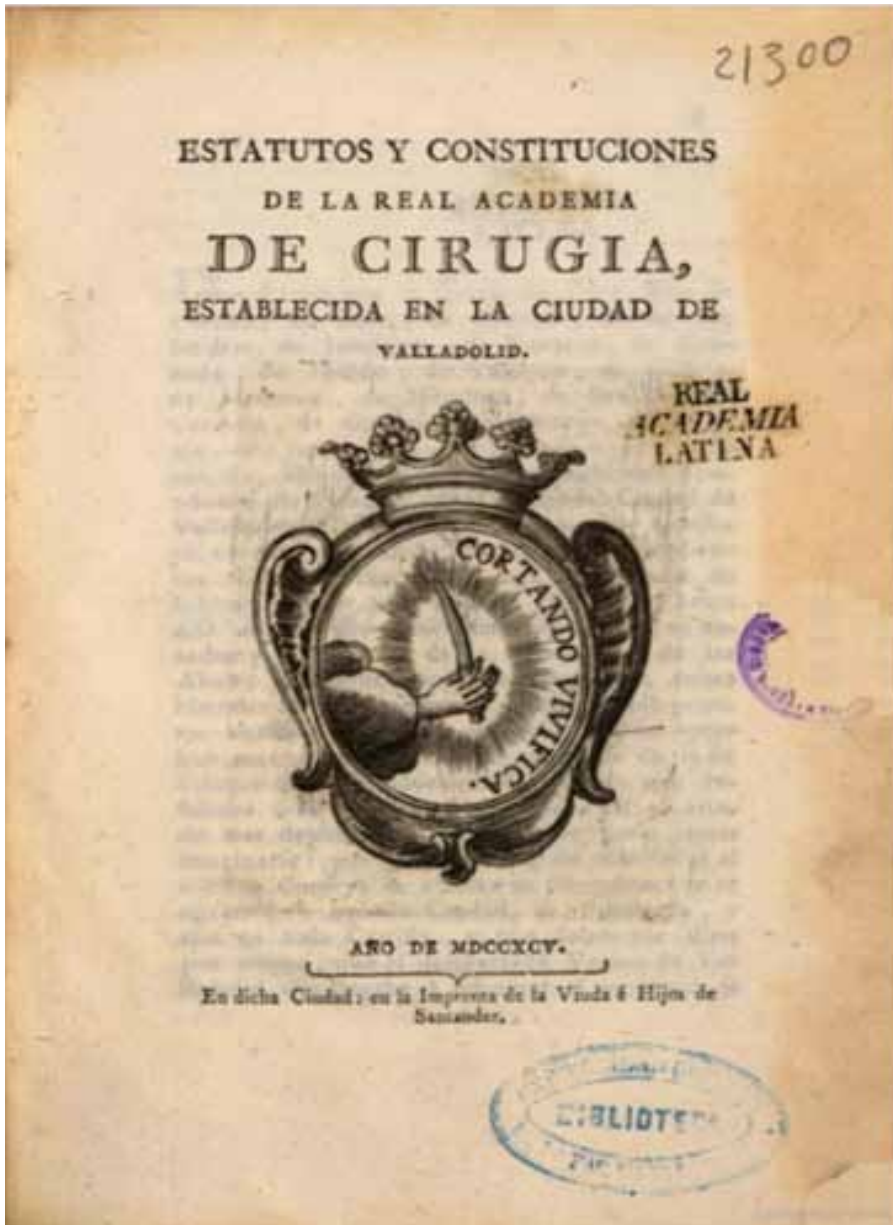
Estatutos y Constituciones de la Real Academia de Cirugía con fecha de 1795

Ha existido una institución en el ámbito de la medicina en Valladolid, de la que se tiene poco o nulo conocimiento, y que fue la Real Academia de Cirugía de Valladolid, y que no tiene que ver con la denominada actualmente Real Academia de Medicina y Cirugía de Valladolid, que precisamente en el periodo que estuvo