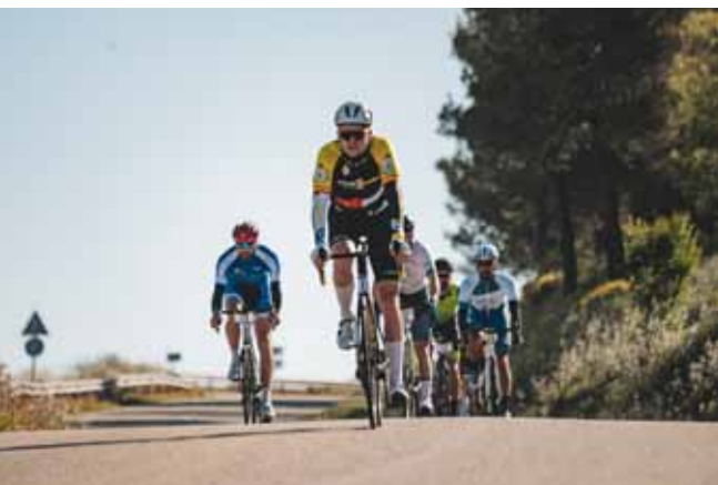
El recorrido estuvo lleno de paisajes preciosos