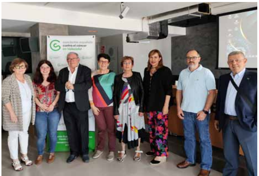
Los participantes en esta jornada posan juntos momentos antes de dar comienzo la misma

“No vamos a obligar a personas adultas que no quieren dejar de fumar a hacerlo, pero lo que sí podemos intentar es que nuestros hijos, sobrinos o nietos no estén en contacto con el humo del tabaco jamás; por ello hemos puesto en marcha el Proyecto Cero, que se presentó el 31 de mayo para concienciar a toda la juventud, porque al final el futuro es de ellos y son ellos los primeros que tienen que movilizarse para conseguir respirar libres de humo”, finalizó.