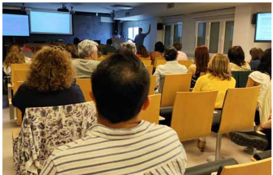
Las jornadas fueron seguidas por muchos colegiados durante los cuatro días que duraron