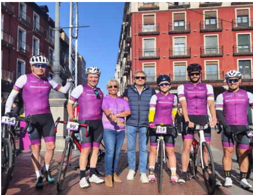
El equipo de Valladolid posa junto al Presidente y la Vicepresidenta del ICOMVA antes de la carrera

Y es que en esta ocasión el campeonato fue organizado bajo el reglamento de la Real Federación Española de Ciclismo, y en él participaron 192 compañeros procedentes de 38 de los 52 colegios de médicos de España, que disfrutaron de la naturaleza y del ejercicio a lo largo de los 70 kilómetros que abarcó el recorrido, que empezó en Valladolid y terminó en Arroyo de la Encomienda. El desnivel de 720 metros que contemplaba la carrera y el viento que dificultó el avance de los ciclistas en algunos tramos no fue impedimento para que todos disfrutasen de un día perfecto en el que compartir la