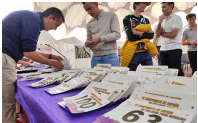
El día anterior a la carrera muchos ciclistas comenzaron a conocerse ya en la jornada organizada para explicar la carrera y repartir los dorsales

pasión por su afición con amigos, pero también con desconocidos que al final del día ya no lo eran tanto.