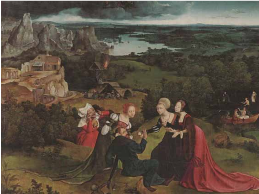
Las tentaciones de San Antonio

El paisaje es un concepto imaginario que nos permite conocer y entender nuestro entorno, mirarlo y establecer una conexión sentimental con la naturaleza. “No hay paisaje si no hay mirada”, una mirada desinteresada y reflexiva a la vez, que busque el placer de la contemplación. Por eso podemos decir que el paisaje “lleva dentro los ojos del hombre; es decir, una perspectiva” (Julián Marín). Azorín hablando del paisaje de Castilla decía que “el paisaje somos nosotros; el paisaje es nuestro espíritu, sus melancolías, sus placideces, sus anhelos...”.