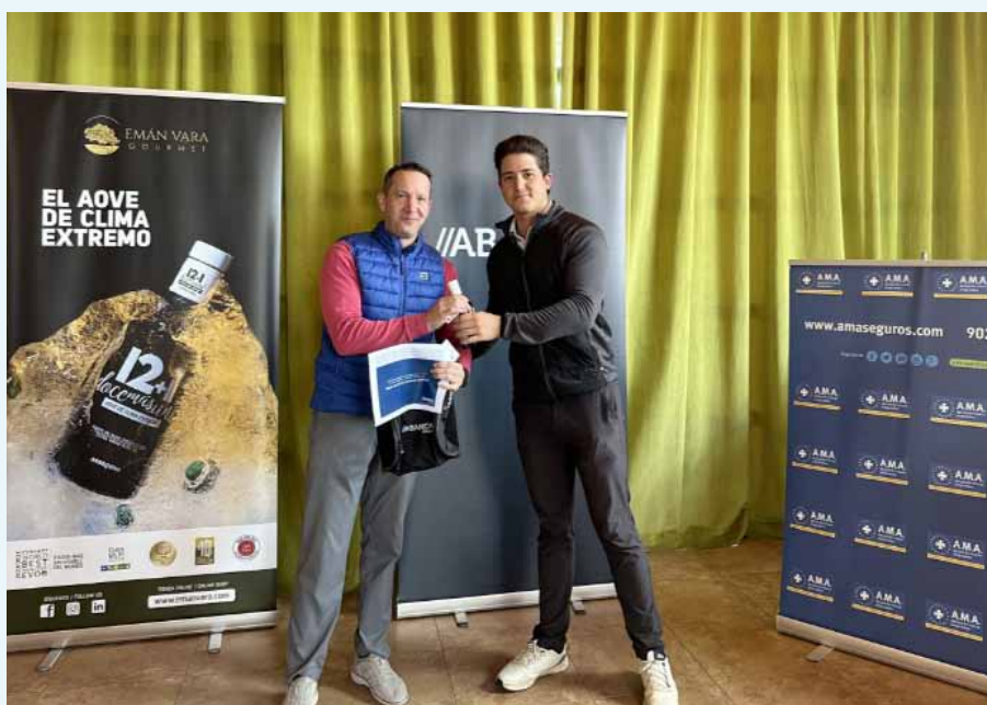
Uno de nuestros patrocinadores hace entrega de su premio a uno de los ganadores del campeonato

Tras varias horas de juego, todos los jugadores pudieron relajarse mientras tomaban unos aperitivos y aplaudían a los ganadores, que fueron recompensados con fantásticos premios cedidos por nuestros