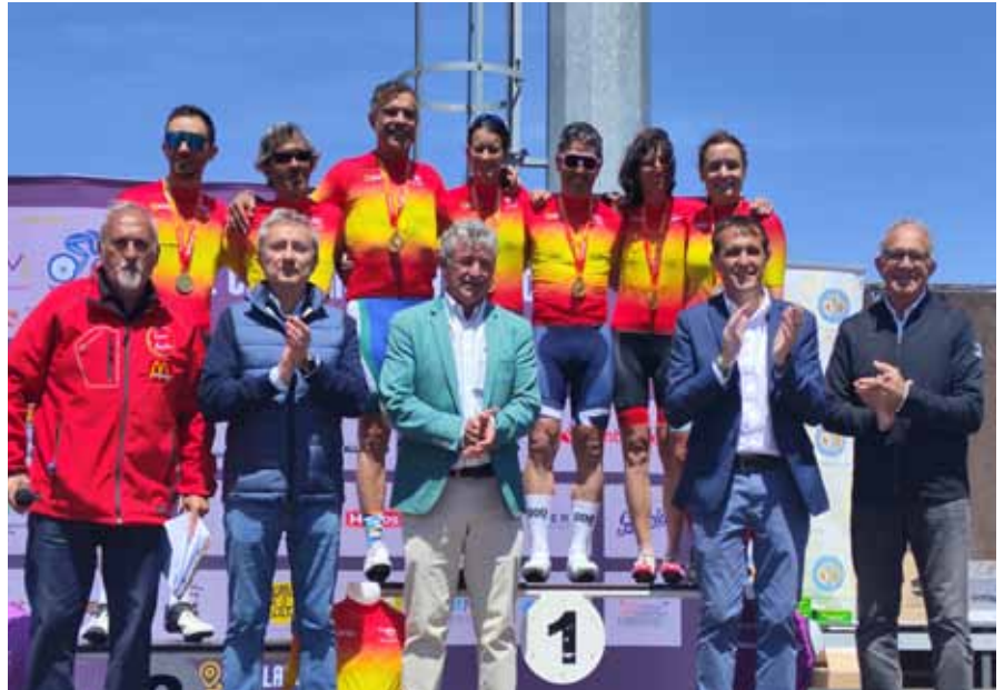
Los ganadores de todas las categorías se subieron juntos al podio al terminar el acto de entrega de medallas